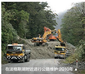
在法格斯湖附近进行公路维护 2010年 ▲

经过千难万阻，隧道终于竣工，当第一辆私家车穿过隧道时人们激动不已，并举行了隆重的庆祝。如今，为了保证游客安全地驾车通过长1.29公里的隧道，对雪崩风险的持续监测和防范工作仍然至关重要。