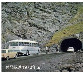
荷马隧道 1970年 ▲