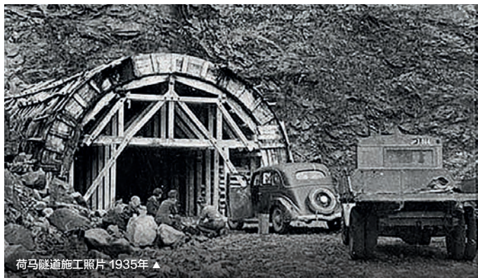
荷马隧道施工照片 1935年 ▲

米尔福德公路的建设可谓“好事多磨”。这条公路从1930年开始建设，期间受二战影响工期被拖延，最终于1954年完工。作为公路一部分的荷马隧道 (Homer Tunnel) 从1935年开工，直到1953年才完成建设。隧道建设初期仅靠五名工人手工开凿，镐和手推车是唯一的工具。工人的生活和工作条件都极其艰苦，他们住在帆布帐篷和简易房屋中，当干雪崩来临时，只能毫无保护地暴露在突如其来的飞瀑和冲击波的危险下。由于没有时间躲避这样的自然灾害，许多工人不幸遇难，混泥土制成的临时居所遭到损毁，隧道入口也被毁于一旦。