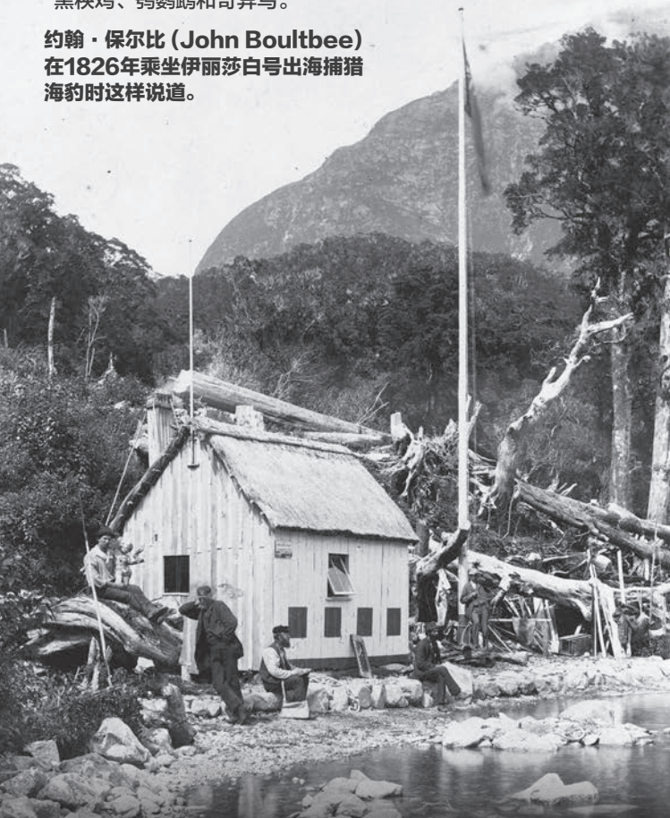
埃斯佩兰斯小屋 (Esperance Chalet), 肯尼迪驻地 (Kennedy Station), 南部地区