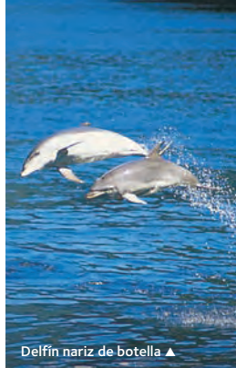
Delfín nariz de botella ▲