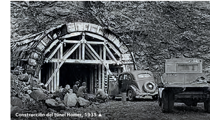
Construcción del túnel Homer, 1935 ▲

Las cosas buenas llevan tiempo. Los trabajos en la carretera comenzaron en 1930, fueron demorados por la segunda guerra mundial, y fueron completados en 1954. La construcción del túnel Homer comenzó en 1935, pero no se completó hasta 1953. Comenzó con tan solo cinco hombres utilizando picos y carretillas. Era un trabajo duro y difícil. Vivían en carpas de lona y edificios improvisados y estaban a la merced de las “avalanchas secas”, caídas sin ruidos, precedidas por una ráfaga de aire comprimido extremadamente violenta. Al no haber tiempo para evitarlas, morían trabajadores, los refugios de cemento eran destruidos y las entradas al túnel eran sepultadas.