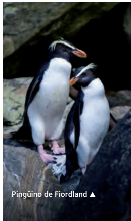
Pingüino de Fiordland ▲