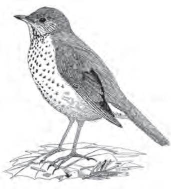
Piopio de la Isla Sur ▲

Debilidad fatal: Demasiado amistoso, lento, fácil de cazar para los depredadores