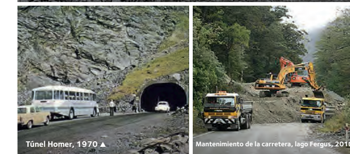
Túnel Homer, 1970 ▲