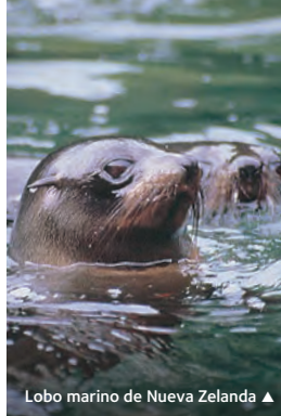
Lobo marino de Nueva Zelanda ▲