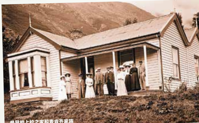
最早的上校之家和麦肯奇家族

具有标志性意义的TSS厄恩斯劳号蒸汽船和瓦尔特峰高地牧场是皇后镇历史上深受人喜爱的一笔。