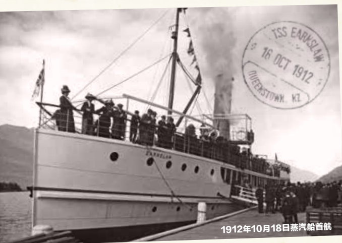
1912年10月18日蒸汽船首航

TSS厄恩斯劳号蒸汽船于1912年首次下水，是瓦卡蒂普湖上最大、最华丽的蒸汽船。这艘蒸汽船是南半球现役的最古老的燃煤蒸汽船。